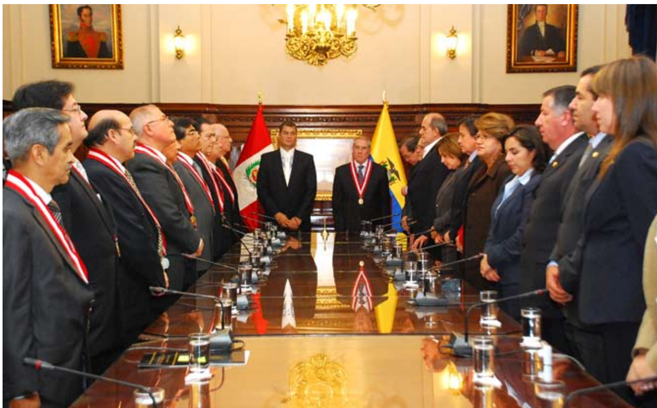
Presidente Correa fue recibido por Sala Plena de la Corte Suprema.

La V Cumbre fue inaugurada por el presidente Rafael Correa Delgado en el Teatro Sucre de la Corte Provincial de Justicia de Cuenca, y contó con la asistencia de las máximas autoridades judiciales de los países que integran la UNASUR.