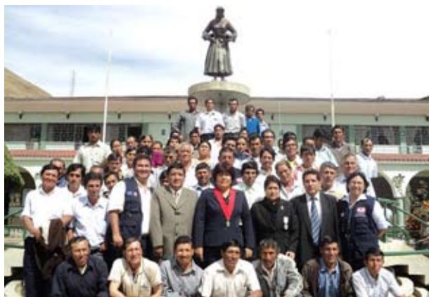
Los jueces de paz posan al final del curso en la Plaza de Armas de Ambo

Con la presencia de 60 Jueces de Paz de la Provincia de Ambo, se desarrolló el primer Curso de Inducción en el auditorio de la Municipalidad del lugar.