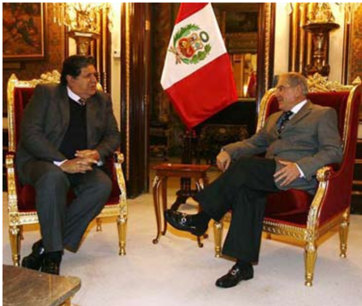
Presidente de la República, Alan García Pérez y titular del Poder Judicial, Javier Villa Stein