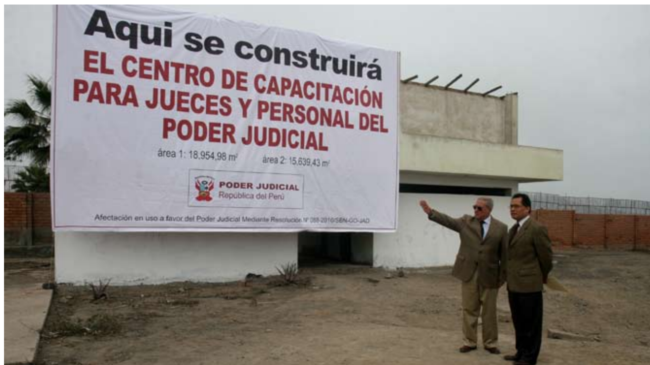
Los lotes de terreno tienen un área superior a los 33 mil metros cuadrados

Jefe de Superintendencia Nacional de Bienes Estatales entregó dos predios en el balneario de Ancón.