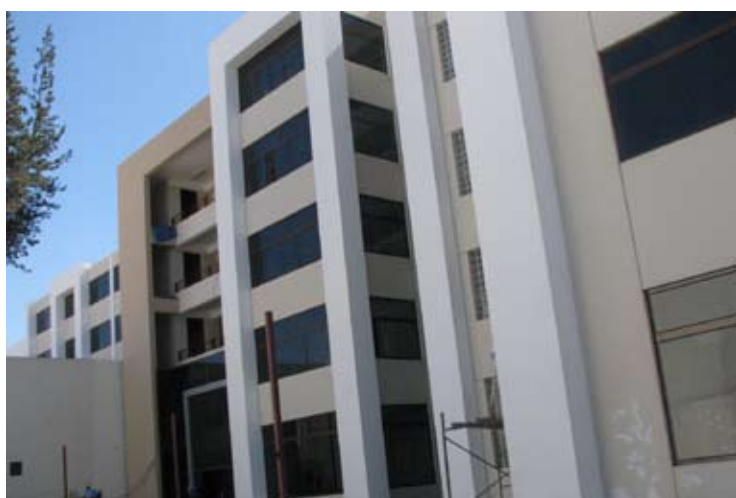
Moderno edificio que será inaugurado en julio

Actualmente los juzgados penales funcionan en áreas habilitadas en el edificio principal de la Corte, en el cruce de la avenida Siglo XX y la plaza de Santa Marta.