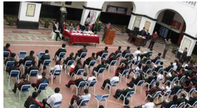
Jueces de la Corte del Callao, expusieron la naturaleza de delitos juveniles al estudiantado del colegio Dos de Mayo.