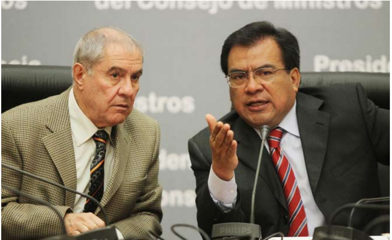
Presidente del Poder Judicial, Javier Villa Stein y Presidente del Consejo de Ministros, Javier Velásquez Quesquén