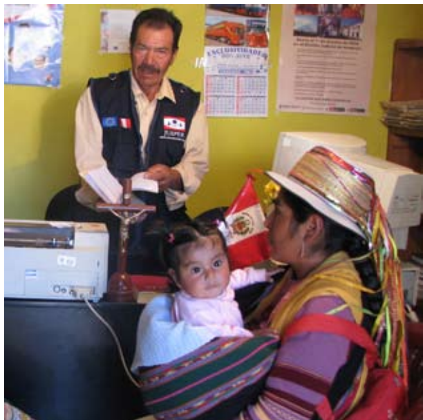
Litigantes de Yanaquigua concurren al local que el Municipio del lugar ha cedido al Juzgado de Paz

cales, habiliten locales para los juzgados de paz en los edificios municipales que posean o, en caso contrario, alquilen un lugar determinado, que procure al juez y eventualmente a su accesorio una dirección fija y permanente, que tenga adicionalmente, la seguridad conveniente a la dependencia judicial.