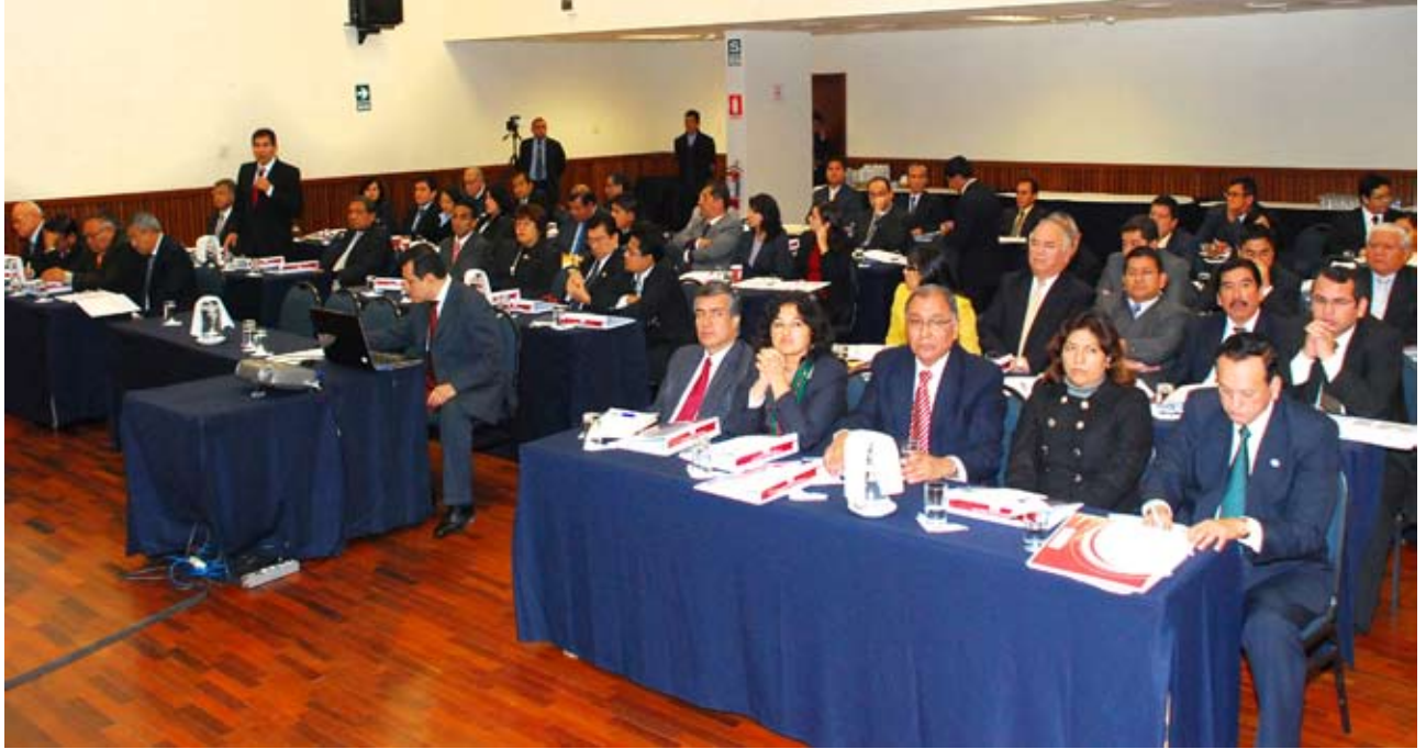
La participación de los presidentes de las Cortes Superiores y sus jefes de Imagen y Prensa fue muy activa.