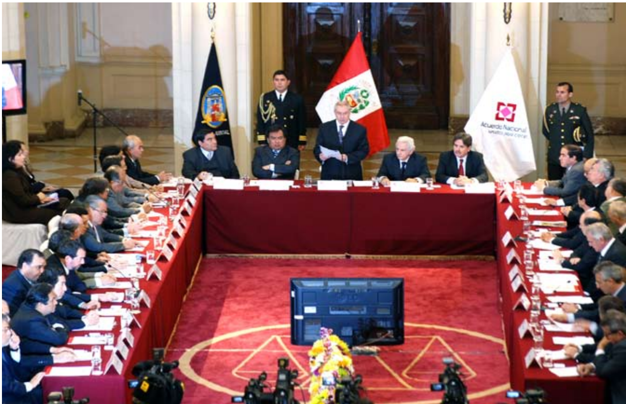
El acto de suscripción se realizó en el Salón Vidaurre de Palacio de Justicia