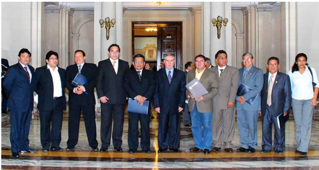
Presidente del Poder Judicial, doctor Javier Villa Stein, flanqueado por alcaldes de Lima Norte.

Una reunión con ocho alcaldes distritales de Lima Norte, sostuvo el 9 de junio último, el Presidente del Poder Judicial, doctor Javier Villa Stein, en el marco de su política de gestión de acercamiento a la población y de apertura total a la comunidad.